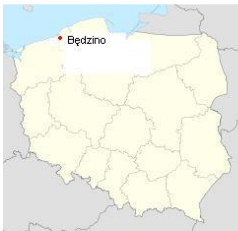
Rysunek 1 Położenie miejscowości Będzino

Najbliższa okolica miejscowości jest obszarem lekko pofałdowanym, bezleśnym, bez wyraźnych elementów hydrograficznych – przez Będzino przepływa bowiem jedynie niewielki, bezimienny strumień.